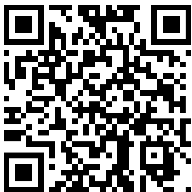
【就學貸款下載專區】